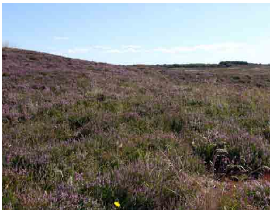
Lønborg Hede har et stort rekreativt og oplevelsesmæssigt potentiale, hvis det bliver åbnet op for lokale og turister.

"Det vil sige, at vi på nuværende tidspunkt kan gå videre med et projekt, hvor vi kan få kædet naturen sammen, og hvor vi kan høste nogle miljømæssige gevinster i relation til Styg bæk og Ringkøbing Fjord." •