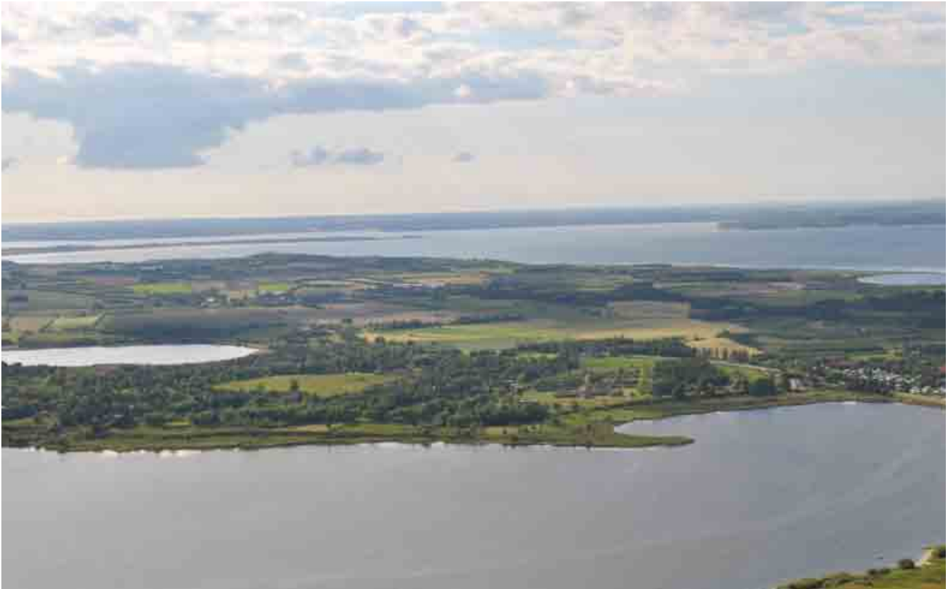
Et stort ønske blandt Skives borgere og landmænd er at gøre naturen mere tilgængelig og sammenhængende, blandt andet via en fjordsti og stier, der forbinder et større område i Nordfjends.

” Vi kan være med til at gøre noget for at øge bosætningen og give folk bedre adgang til naturoplevelser. Og det har været en stor sidegevinst ved projektet at få en dialog mellem os jordbrugere og de andre borgere i området.