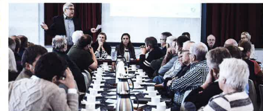
Fra lodsejermødet i Klim d. 28. april 2016.