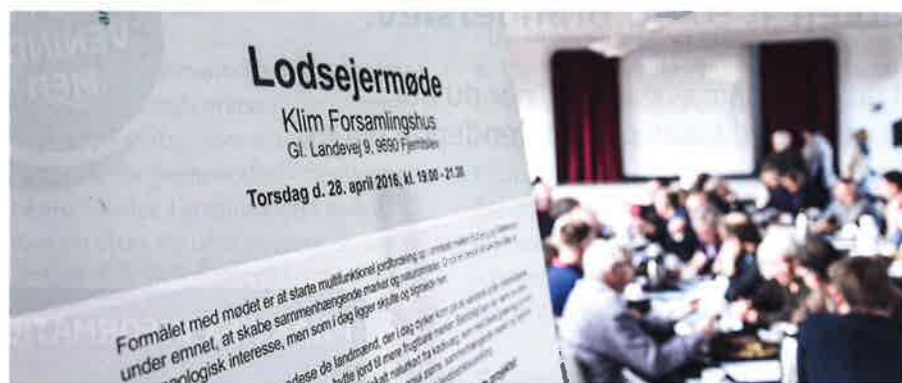
Fra lodsejermøde.